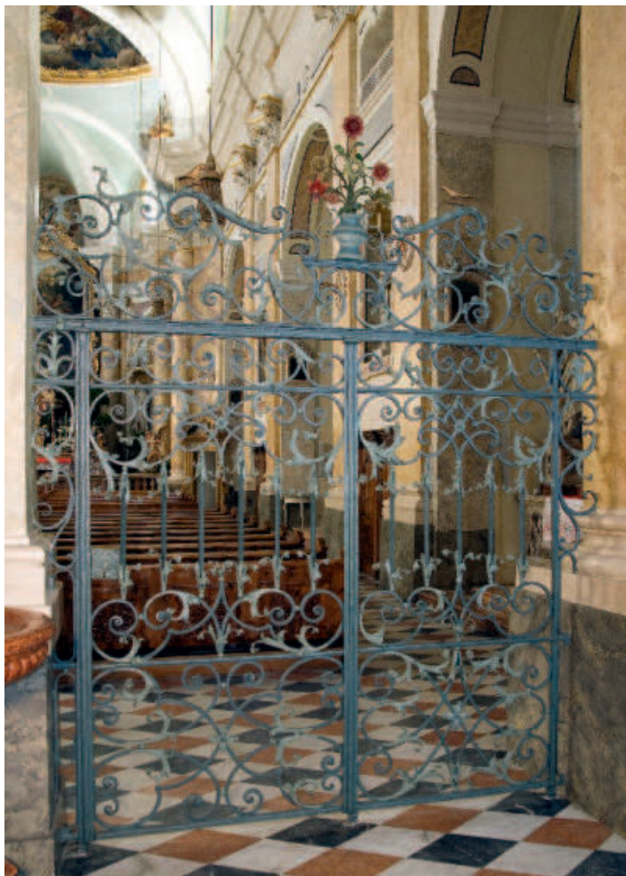
Eisengitter zwischen Vorhalle und Kirchenschiff, übertragen aus dem aufgehobenen Kloster der Coelestinerin- nen in Gries

Muri und zum neuen Sitz des Abtes (bis heute gültig). Aufgrund dieser Rechtslage wurde die Kirche des hl. Augustinus, die zwischenzeitlich in den Besitz der Gemeinde Gries übergegangen war, dem Priorat der Abtei Muri in Gries zu immerwährender Nutznießung überlassen, unter der Bedingung, dass die Pfarrgottesdienste